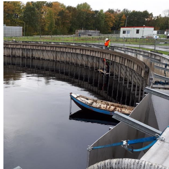
Maatregelen Aad Waterschap de Dommel