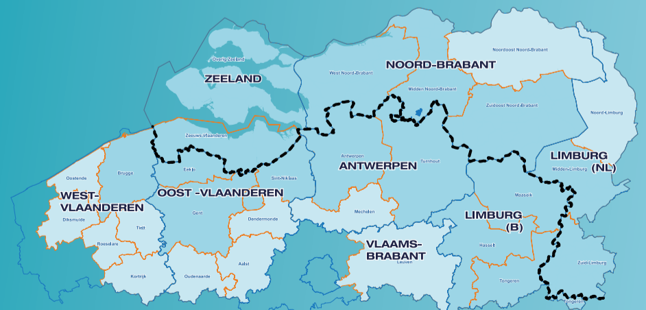
kaart van het programmagebied

Gemeenschappelijk Secretariaat Grensregio Vlaanderen-Nederland Belpairestraat nr. 20, bus 10, B-2600 Antwerpen (Berchem) Tel: +32 (0)3 240.69.20 Fax: +32 (0)3 240 69 29 Email: info@grensregio.eu