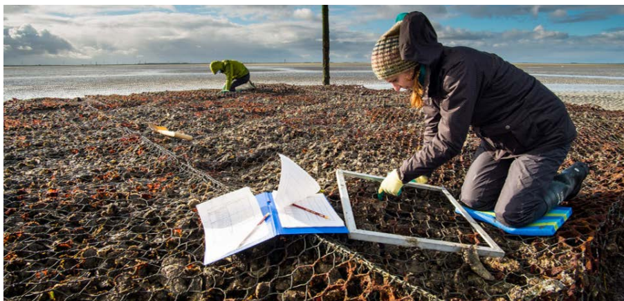
Studenten van de HZ University of Applied Sciences brengen de hardsubstraatorganismen in kaart op de aangelegde oesterriffen.